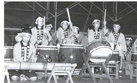
▲見事なばちさばきを披露した方城町の方城和太鼓クラブ