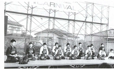
▲礼に始まり礼に終わる。金田町剣友会の演武