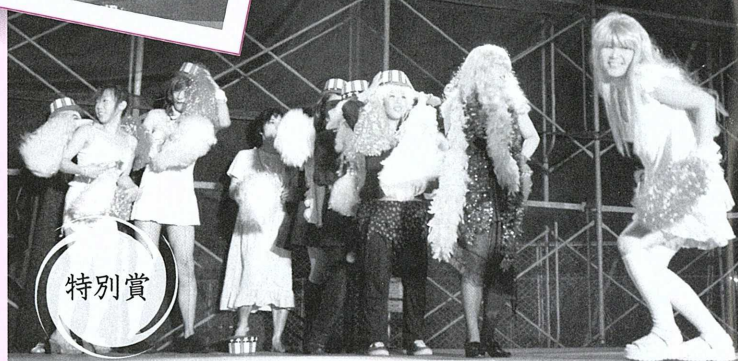
▲職場の仲よしチームでノリノリのダンスを披露した『JOYJOYダンサーズ』