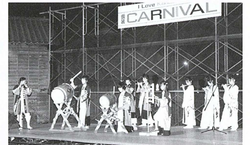
▲会場いっぱい祭りばやしを響かせた赤池町の豊前福智囃子