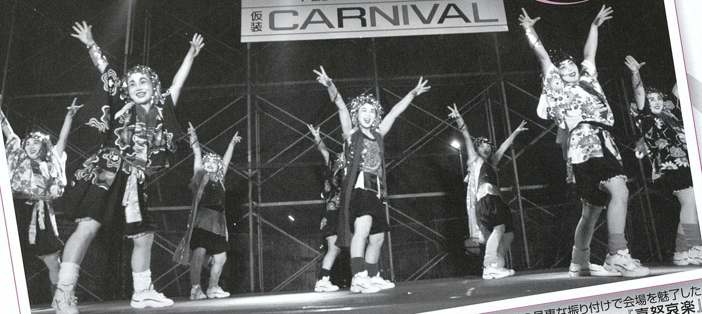
▲「マツケンサンバⅡ」の見事な振り付けで会場を魅了した『喜怒哀楽』