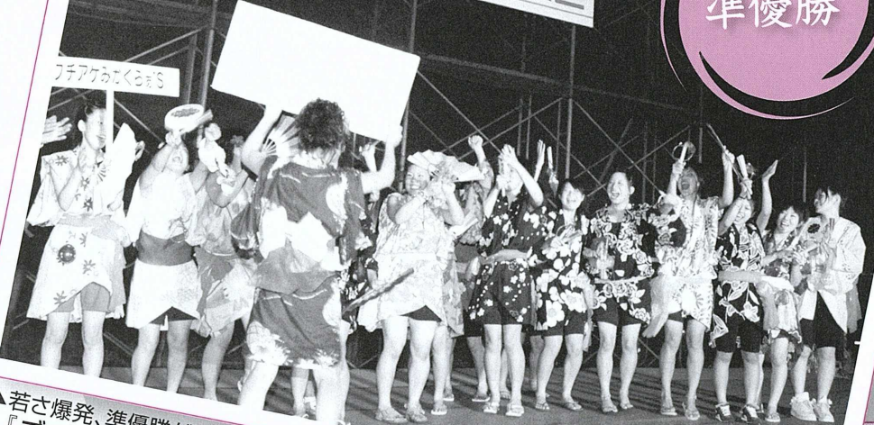
▲若さ爆発、準優勝ゲットに大喜びの『ブチアゲみかぐらあ'S』