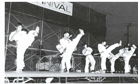
▲気合い十分。空手道錬心館の演武