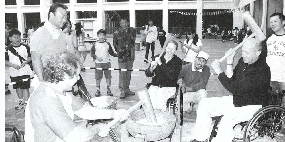
ムスカシイネ もちつきを楽しむ選手たち

5月20日、金田町屋内競技場で国際交歓会が催されました。 選手たちは、心のこもった料理やアトラクション、子どもたちとの会話を楽しんだり、もちつきや踊りに参加して金田の夜を満喫しました。 平成3年に「金田町」と同じ名前である「カナダ」の選手との交流をきっかけとして始まった交歓会も今回で15回目。そして、「金田町」としては最後の国際交歓会。来年からは「福智町」になりますが、また来てくださいね。