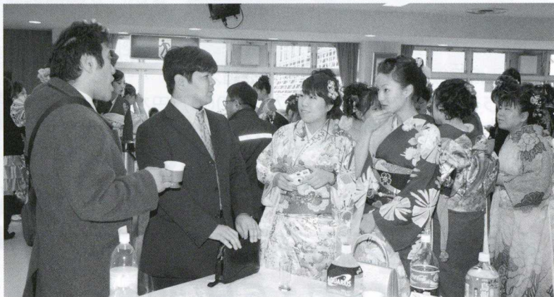
▲「先生、お久しぶりです」 「お〜っ！ 久しぶり。おまえら、元気じゃったか？」