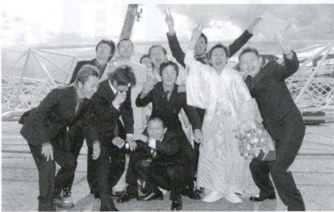
▲雪にも負けない元気者