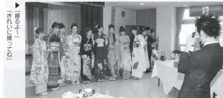
▶「揺るぎない」 「きれいに撮ってね」