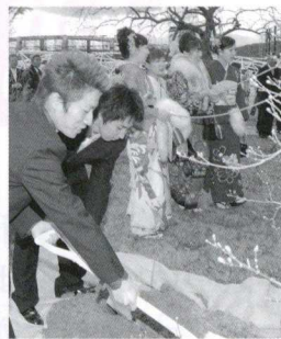
▲力を合わせて記念植樹