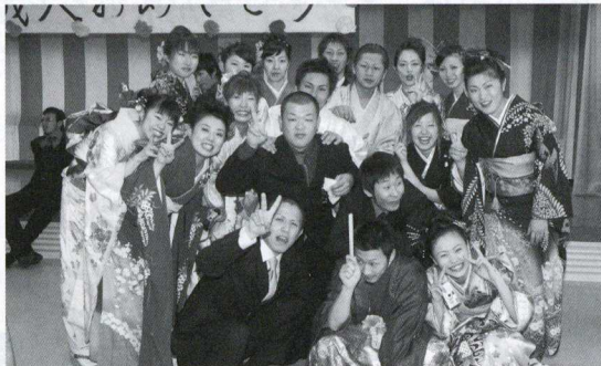
◀みんなノリノリ。ん！休憩してるのは誰かな？ 後ろで