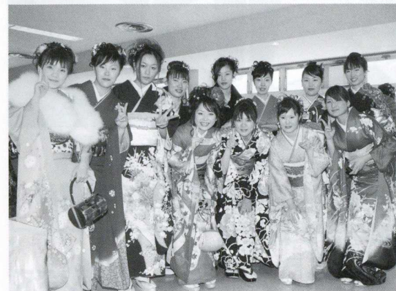
▲晴れ着姿でハイ、ポーズ