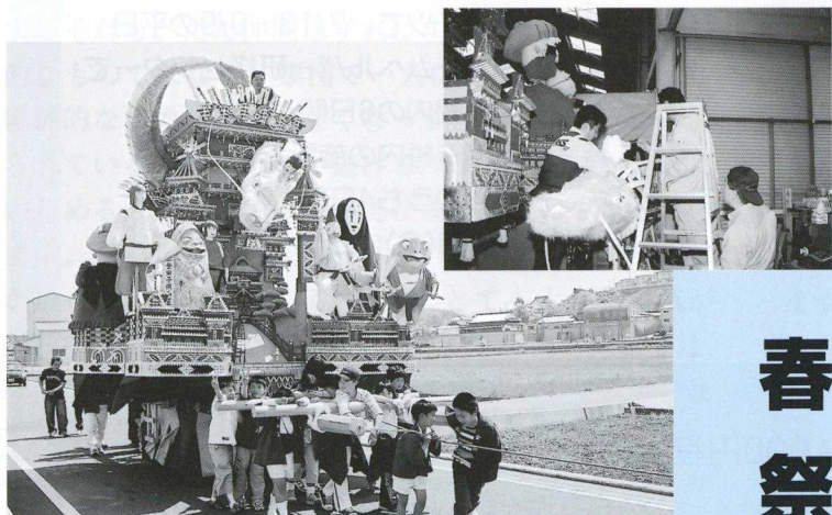
▲ 人形も手づくりの上金田子ども山笠 (写真右上は製作の様子)