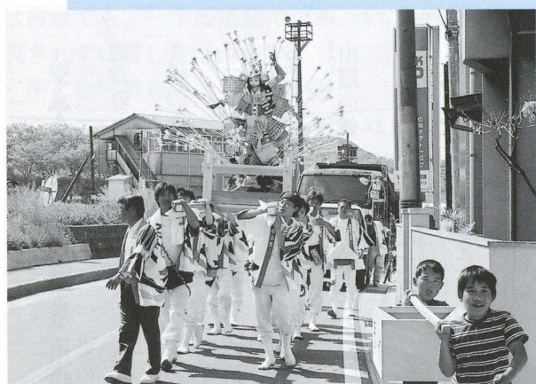
▲ 武者人形をのせた平原の青年神輿