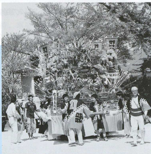
▲ 菅原神社を出発する 町部の子ども山笠