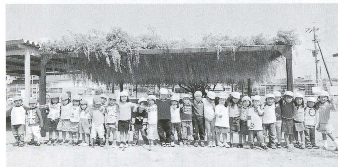
藤の花がきれいだよ！ (4月23日 宝見保育園)