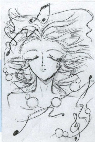
ペンネーム 藤重 薫さんの作品

お問い合わせ ガールスカウト福岡連盟第39団 団員長 鍋藤 ☎42-4931 事務局 中川 ☎42-0009