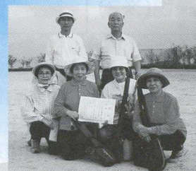
四区交友会チーム

9月19日(木)・25日(水)に町民会館で行われた、カローリング大会、優勝は宝見Aチームでした。