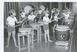
金田保育園 園児による和太鼓演奏