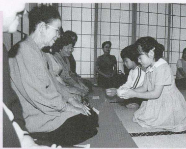
お茶の接待。緊張気味の孫たちに、おじいちゃん、おばあちゃんもおもわず緊張

9月18日(水)、金田保育園で園児が、おじいちゃん、おばあちゃんを招いて交流会を行いました。手作りのしおりを添えて、一人一人手渡しで花束を贈った園児たち。孫からの心のコモったプレゼントに、おじいちゃん、おばあちゃんは顔をほころばせ、満面の笑みでうれしさを表していました。