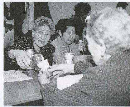
どうぞ、どうぞ。まあ、一杯