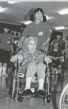
車いすの移動は慎重に。第二長寿園にて