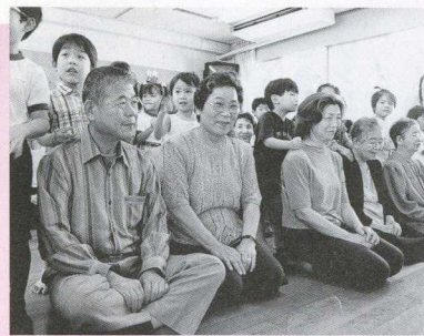
あー気持ちいい。孫の愛情こもった肩たたきに、みなさんご満悦