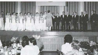
グリークラブ金田、コール金田によるハーモニーが会場を魅了しました