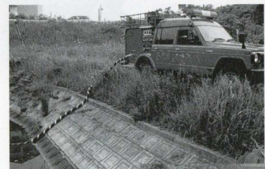
蟹ヶ迫池から取水開始