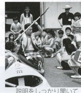
説明をしっかりと聞いて