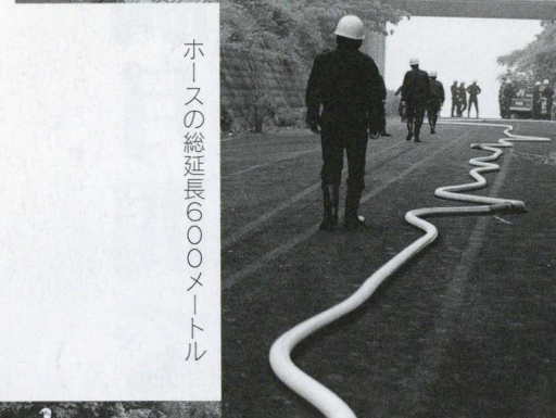
ホースの総延長600メートル