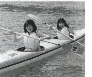
2人いきをあわせて