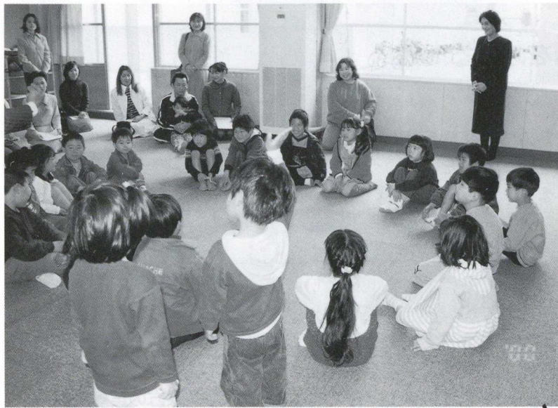
「金田小学校学童クラブ」が開所しました!