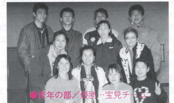
●青年の部/優勝…宝見チーム