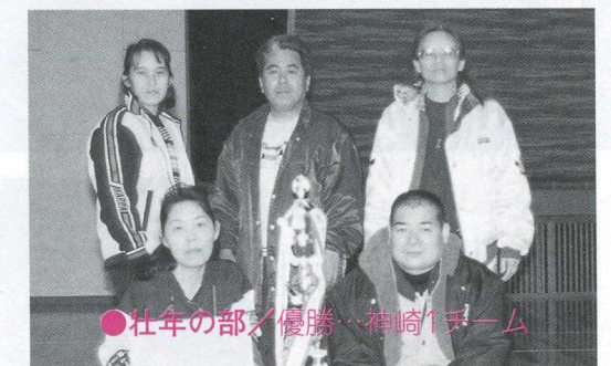
●壮年の部/優勝…神崎1チーム