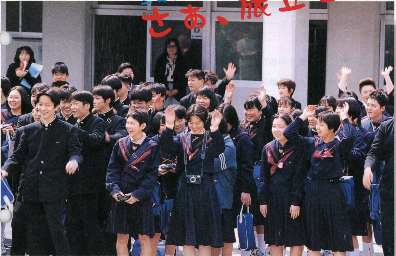
中学校卒業生たち。玄関前での一コマ。(内容は8ページに掲載)