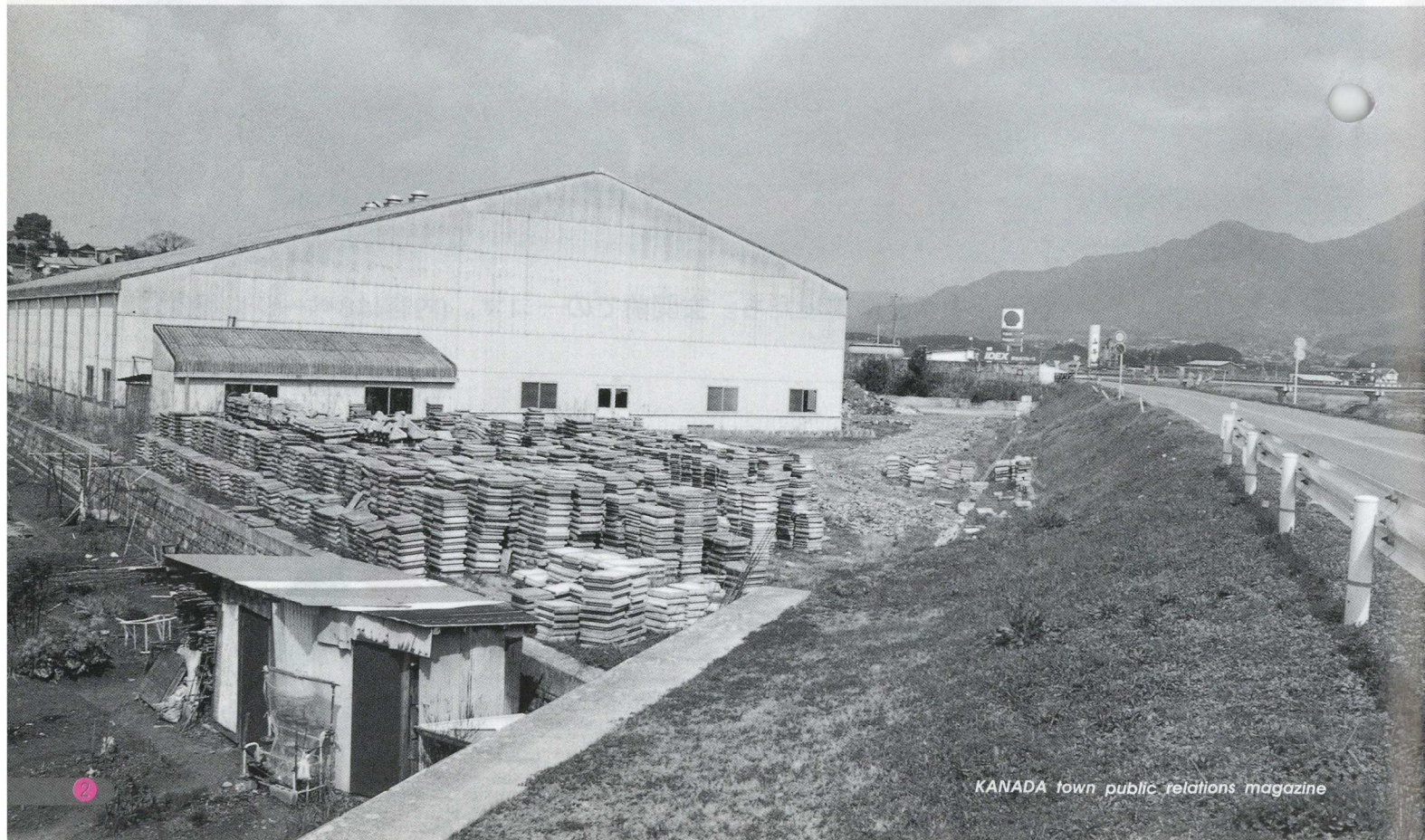
↓産業廃棄物中間処理施設建設計画が持ち上がっている県道横の工場跡地

建設計画が持ち上がっている施設は、直方市の業者が金田、赤池両町にまたがるブロック工場跡地の中の約500平方メートルを利用して産業廃棄物中間処理施設を建設しようとしているものです。