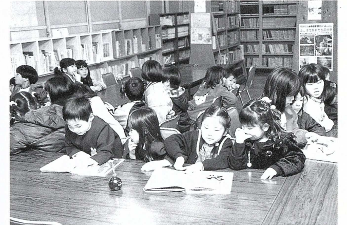
図書室で本の多さにびっくり。「本屋さんみたい…」

今年の新一年生には89人(2月20日現在)です。この日は、83人が出席し、4月からの小学校生活に心躍らせていました。