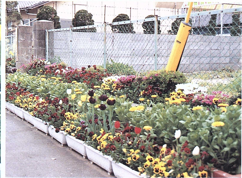
どこかで、見つけた