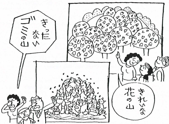
お花見マナー 自分のゴミは自分で持ち帰りましょう

・収集日は、間違えないようにそして、前日に出さずに指定日に出しましょう。(犬や猫にねらわれます)