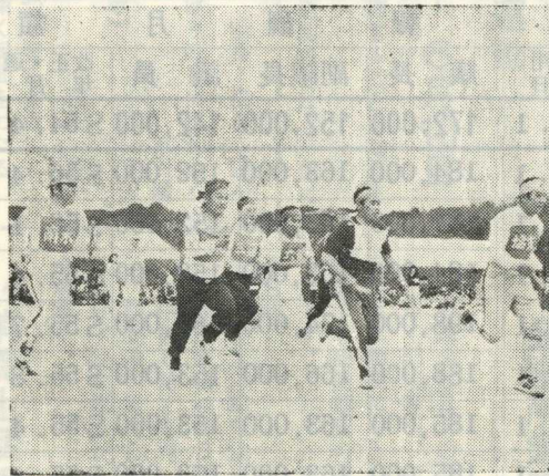
〔公民館対抗200オリレー〕

去る五月十七日町民体育祭が金田中学校校庭に於て、住民一千五百人が参加し華々しくかつも盛大に行なわれました。この行事は町民の親睦と融和、体力づくりを目的として行うもので、今年で8