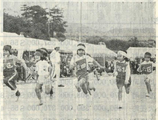
〔地区子供会対抗リレー〕

回目を迎えることができました。これもひとえに町民皆様方の金田町社会体育に関する御理解のたまものと存じます。