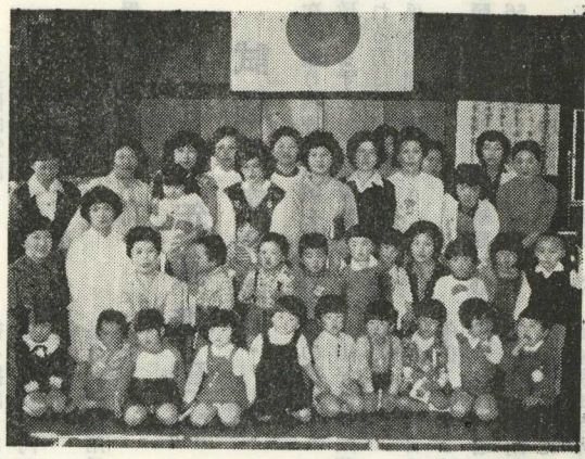
〔三才児検診入賞者〕