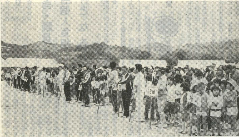
〔開 会 式〕

去る五月十七日町民体育祭が金田中学校校庭に於て、住民一千五百人が参加し華々しくかつも盛大に行なわれました。この行事は町民の親睦と融和、体力づくりを目的として行うもので、今年で8