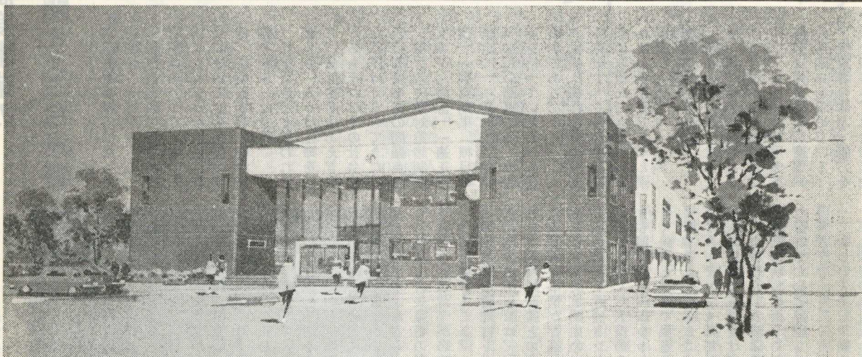
町民会館完成予想図 (九月末完成予定)