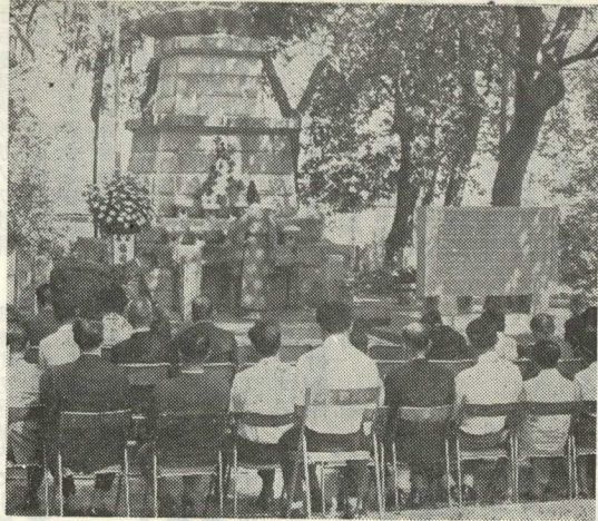
【稲荷神社において撮影】

九月二十五日の初秋、秋荷神社の境内にある忠魂碑前晴れのもとすがすがしい稲荷の前でおそかに第一回の慰霊祭が挙行されました。 去る昭和四十七年十月に建立されました、日支軍大東亜戦争における戦死死者二百五十二名の名前が記された碑の前に哀悼の意を表した次第であります。 参加されました、ご遺族の方八十三名、他に主催者並びに来賓の方々をあわせて九十八名の多きに達しました。二百五十二名の戦没者に比較しますと、未だしの感を禁じえません。 今後、毎年同所におきまして慰霊祭を挙行致しますので、ご遺族の全員の参列を希望します。 地下に眠る国の礎となられた英霊に対し、深い感謝と今後の日本の平和を祈願いたしまして、ご報告にさせていただきます。