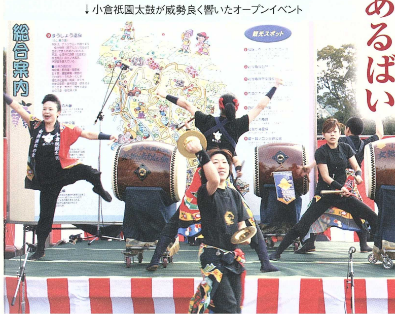
↓小倉祇園太鼓が威勢良く響いたオープンイベント