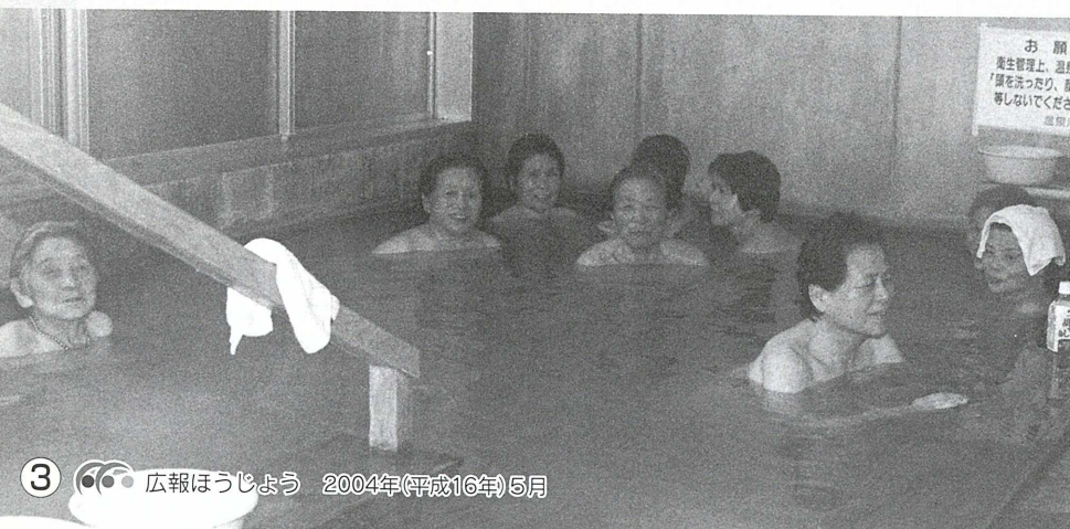
▲ほんのじきへんじ