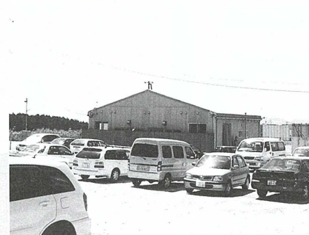
▲平日でも、混んでます