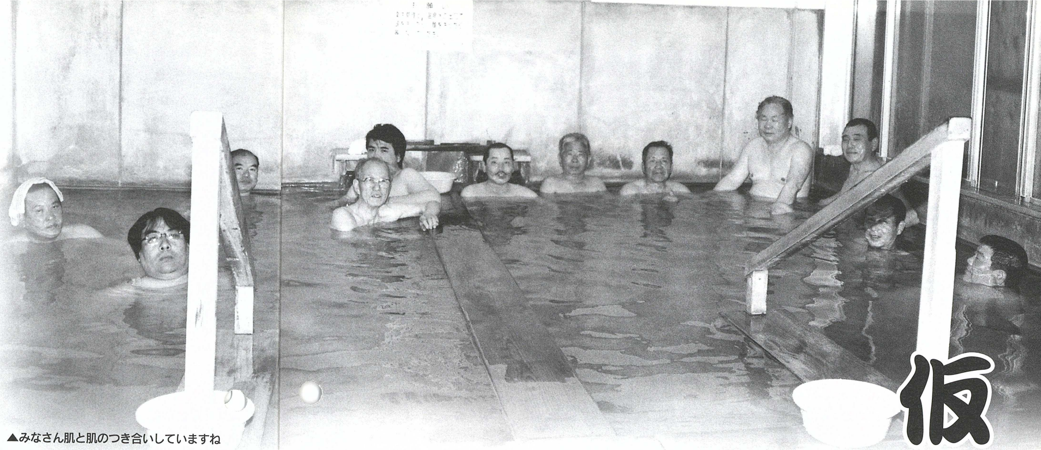
▲みなさん肌と肌のつき合っていますね