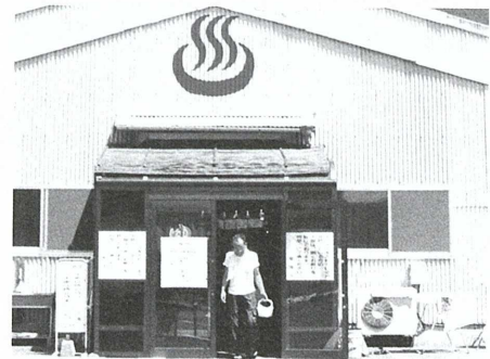
▲あ〜ひとつ風呂浴びて、さっぱりした