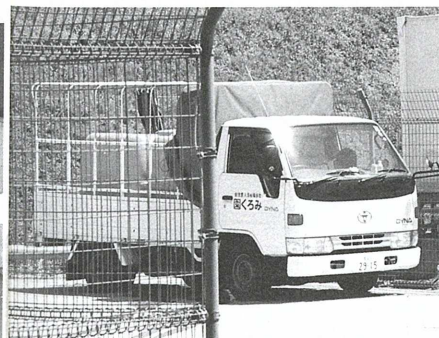
▲施設の車も温泉水を汲みに来りました