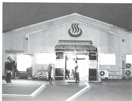
▲夕方からは家族づれの姿が多くなります

秋に新しく、大きな浴室と設備の整った コミュニティセンターとして、オープンします。 みなさん待って下さいね。