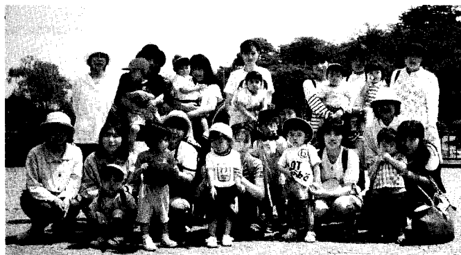
5月19日 バス遠足 (勝盛公園)

5月から10年度の行事を行っています。新しい親子の方も増え、少しずつですが子育て支援センターとはどのような場所なのか、浸透しつつあるようです。お茶を飲みながらの子育て談議がくつろぎのひとときとなり、お母さんの表情もキラキラ。みなさんも生き生きと子育てしましょう。