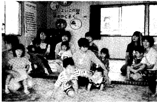
5月28日 ホワイトシアター