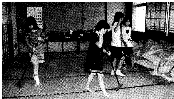
おそうじも上手になりました

5月21日から23日までの2泊3日で、小学校4年生から6年生までの28人の子どもたちが参加して通学合宿が行われました。今年の通学合宿は少人数にしほったことで指導が徹底でき、自主的に動く姿が目につきました。夜に行われた交流会では、牛乳パックを使って鉛筆立てを作ったり、映画鑑賞をしたりして楽しんでいました。また最終日には、福岡市の九州エネルギー館と福岡市動物園に見学に行き、楽しい一日を過ごしました。