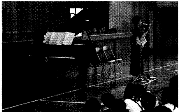
伊方小学校の体育館で演奏する日本フィルのメンバー

6月4日に、伊方小学校の体育館で日本フィルのミニコンサートが行われました。バイオリンとピアノの二重奏で、「トルコ行進曲」をはじめ、「ガボット」など全6曲が演奏されました。ピアノを習っている子どもは、特に目をクルクルさせて流暢な指の動きに見入っていました。日本フィルのコンサートは、8月と秋に田川で開催される予定です。