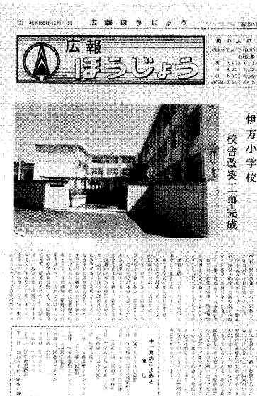
伊方小学校 校舎改築工事完成

昭和44年までの6年間はタブロイド版のスタイルは変わらず、昭和44年12月15日発行の第54号からは、またB5サイズにもどり4ページとなりました。