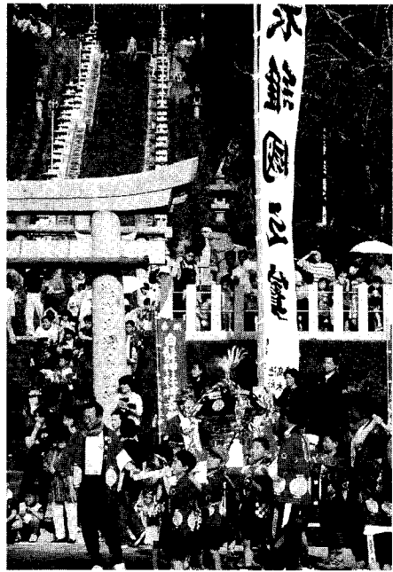
白髪神社前で練る子ども神輿

5月4日、5日に伊方地区、9日10日に弁城地区の神幸祭が行われました。この中で、白髪神社のお祭りは例年とひと味違ったお祭りになりました。それは、東古門の子ども会が作った子ども神輿が登場したからです。約25キログラムの神輿を10人の子どもがかつぎ、大人に負けないくらいの威勢で町を練り歩いていました。