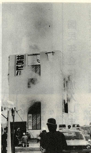
消防署職員への信頼感をいっそう深めました。

無線通信、日赤社員による負傷者救助訓練、その他いろいろの訓練が行われましたが、何と云っても架設のビル(福吉ビル)での火災被難者の救出訓練は、見ごたえがありました。消防署員のロープ一本による、数通りの救出方法を目前にして、千数百人の見学者は、