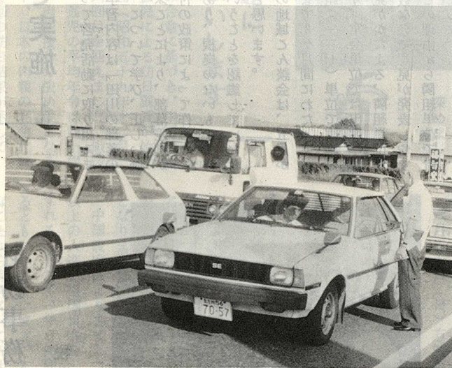
県道田川～直方線バイパスにて

昭和五十六年度から、毎年七月一日〜三十一日を「同和問題啓発強調月間」と定め積極的に啓発活動を推進してきました。方城町では、本年度の同和問題啓発強調月間の行事計画を、次のとおり計画致しました。町民みなさんの多数参加と、ご理解ご協力をお願い申し上げます。