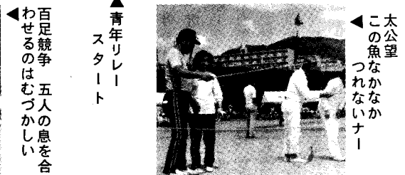
この魚なかなかな つれないナ