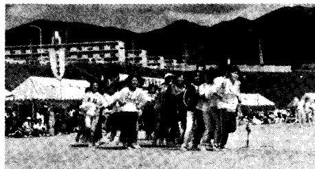
二人三脚 タイミングがあわない