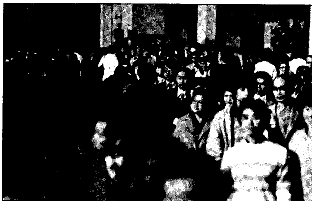
もし、あなたが「通り魔」犯罪の被害にあったら

いわゆる「通り魔」などの犯罪によって、死亡したり重障害を受けた人やその遺族を救済するため、給付金が支給されることになりました。これは、第91回国会で成立した「犯罪被害者等給付金支給法」の施行によるもので、昭和五十六年一月一日以降に発生した犯罪による被害から適用されます。