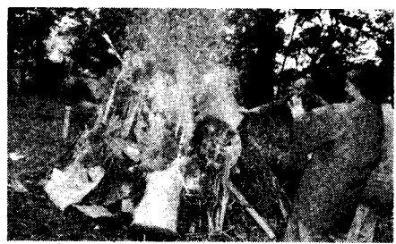
1月20日(日曜)方城句会「どんど焼」風景

◎ 振替納税制度 所得税の便利な納税の方法として、振替納税制度があります。振替納税は、あらかじめ税務署と金融機関に依頼しておきますと銀行などの預金口座から振替えによって納税することができ、納税のための手数料が少なくて済み、大変便利です。