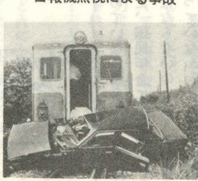
警報機無視による事故

④ 三〇一五番・福岡県立西田川高等学校(田川市番田町、電話上本町 電話④〇六六 四番)