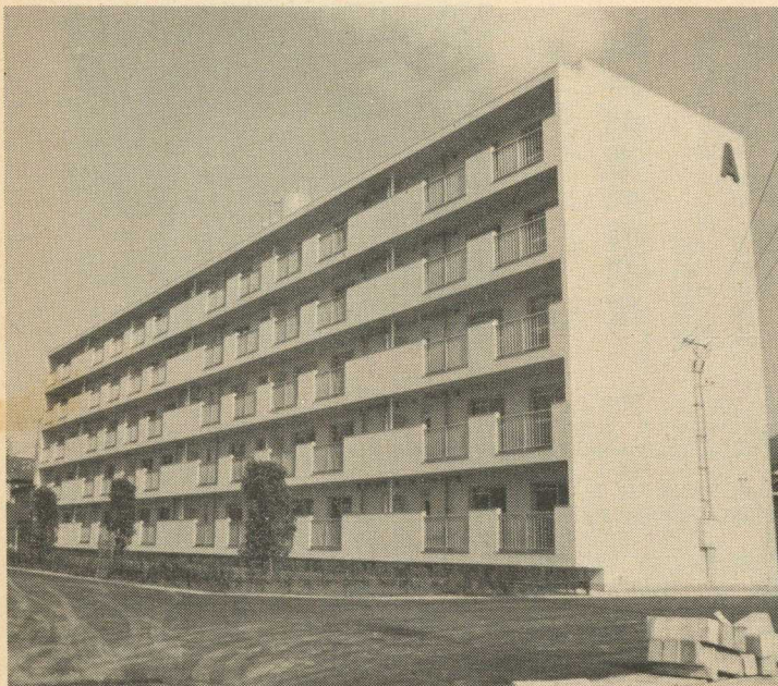
湧 淵 団 地 (町営住宅)

明るい方城町、住み良い方城町の町づくり、町民の皆様方のご指導とご協力をお願い申し上げます。