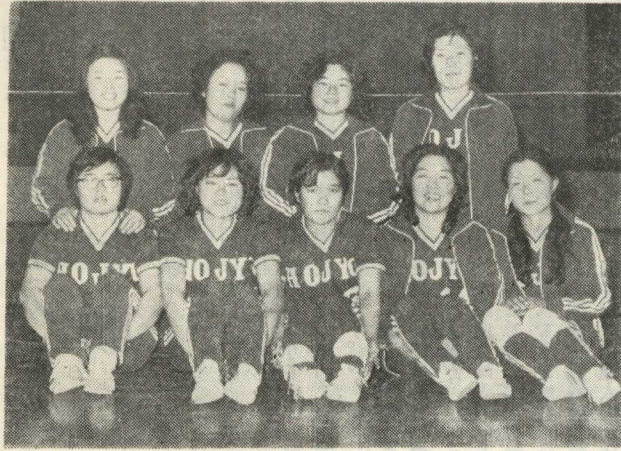
方城町バレーボールチーム