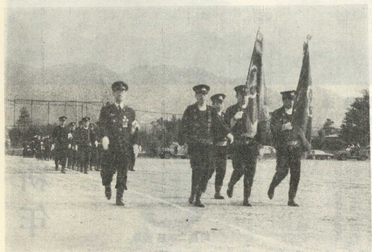
(町本部団員の分列式)

石油危機のあおりで、福良町各々では新春恒例の消防出初式を中止した市町が、下田川四カ村が、例年通り消防団では、例年通り消防二十台、消防団員四百二十人が出動して四十九年一月六日午前九時三十分から赤池中学校で実施したが、石油節約のため、消防自動車の放水訓練は取りやめ、服装点検、分列行進及び優