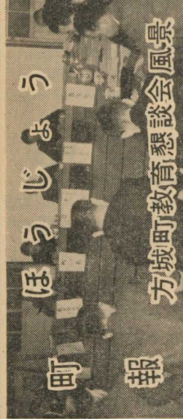
方城町教育懇談会風景

No. 31 昭和39年1月15日 発行所 福岡県田川郡方城町 印刷所 文化印刷所 田川市東区川田②4199番 電話