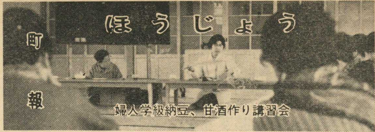
婦人学級納豆、甘酒作り講習会

三月二十日より昭和三十七年度の保険証の検認を行います。これは被保険者の実数を明らかにして、的確な給付並びに課税を行なうためです。