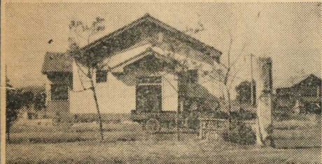
【写真説明】竣工間近い青年、婦人研修所

社会の不幸を無を起しました処、左記の通り御協 助、皆さんが力を戴きました。 幸せである様に と、昨年の暮れ 例年の通り歳末 たすけあい運動