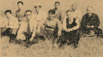
山上に勢揃いした現地踏査の一行