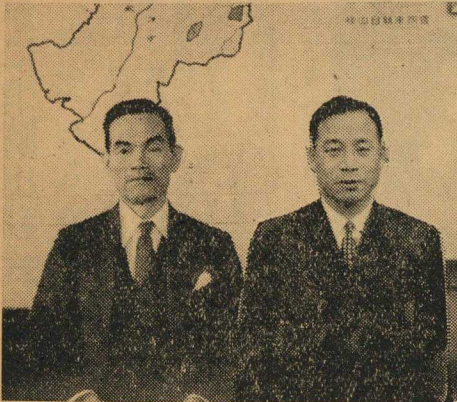
正式調印を終えた両者(町長室にて)