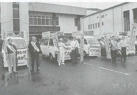
▲啓発タスキリレーの第1“歩”者

7月は「差別のない明るいまちづくり」をテーマとして、同和問題啓発行事に取り組んでまいりました。町内小中学校の児童・生徒によるポスター標語の展示を始めとして、恒例の「啓発タスキリレー」ふれあい体操会、同和問題講演会等を行ないました。町民一人ひとりが、同和問題を正しく理解し、住みよい町づくりと二十一世紀に差別を残さないことを再認識した、意義ある月間だったと思います。期間中の諸行事に、参加された多くの町民のみなさまに、心より感謝申し上げます。又、差別撤廃までのご協力を願ってやみません。