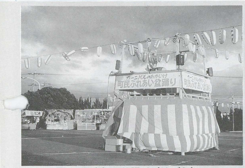
▲一昨年の盆踊り(やぐら)

○とき 8月17日(火) 午後7時～ ※雨天の時は中止 ○ところ 赤池町民会館 広場 ○内容