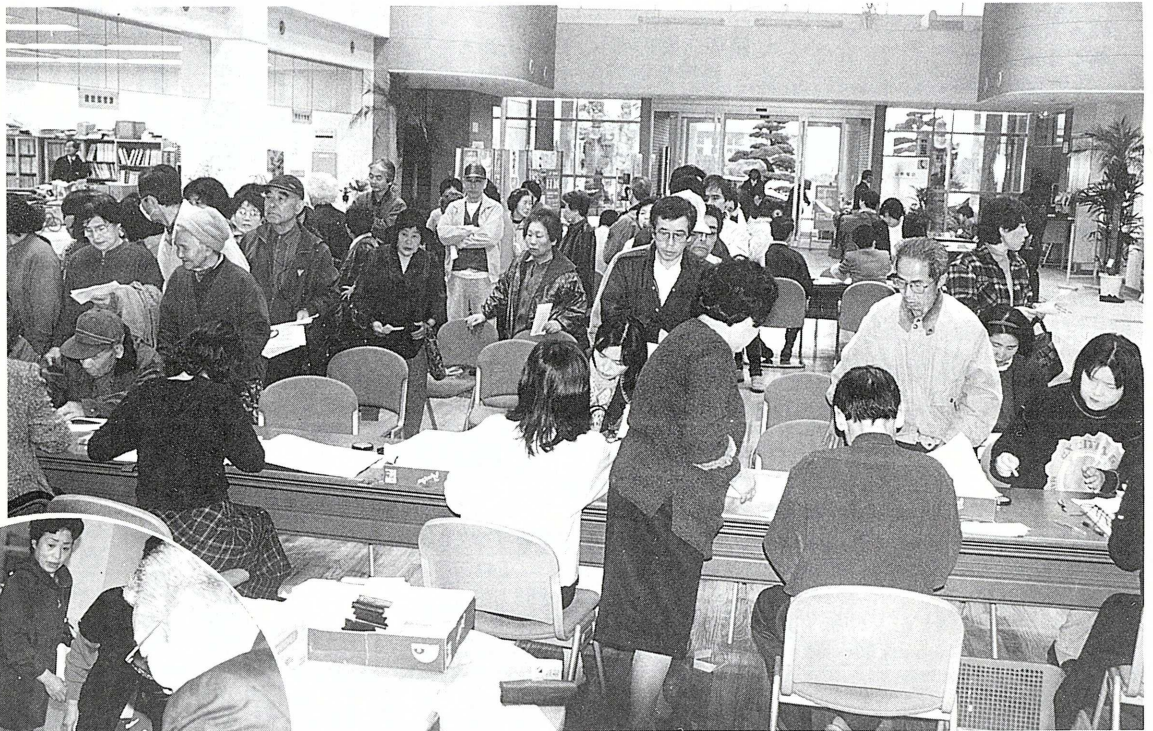
▲庁舎玄関ロビーでの交付風景(3月15日)

3月15日、赤池町の「地域振興券」が交付されました。町内対象者は約3350人ぐらいですが、当日は、1300人程の方が交付を受けました。役場玄関ロビーは、多くの人で一時は大混乱。この振興券は、9月14日まで町内の取扱い店で利用できますが、交付の目的どおり、地域経済の活性と“元気の出るまち”にしたいです。