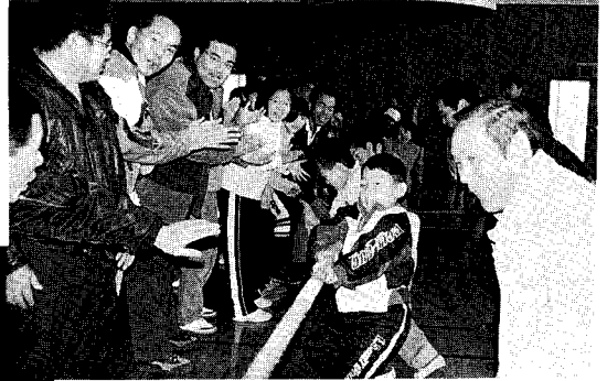
▲子どもの部 優勝の3区チーム