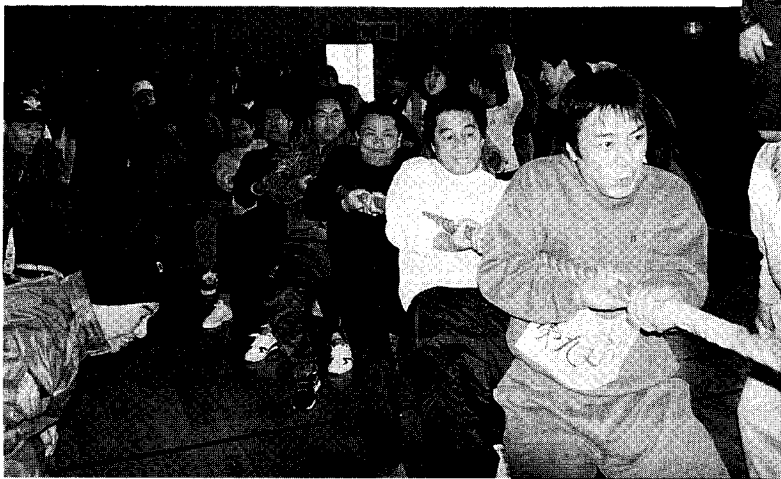
▲初優勝の9支所チーム(男性の部)

1月24日、町民会館で、第12回町民綱引き大会が行われました。今年、常勝3区の3部門完全制覇が成らず、男性の部で第1回より優勝記録を伸ばしていた3区チームが9支所に破れるという大波乱。