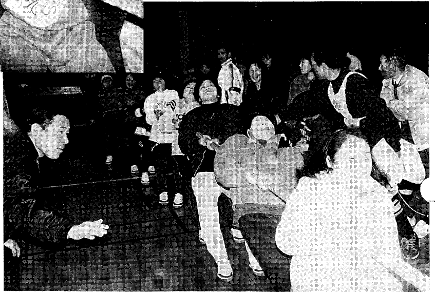
▲女性の部優勝の常勝3区 ママさんチーム

猫は、人の生活に潤いをもたらすパートナーです。しかし、その陰で鳴き声や悪臭など、ペットをめぐるトラブルが絶えません。「世話が大変」「かわいくなくなつたから」と、安易に飼育を放棄することもあるようです▼昨年度、全国の保健所などで引き取られ、処分された犬は約二十一万頭、猫は三十万匹。こうした悲しい現実をなくすためにも、動物の一生の面倒を見るという覚悟が、飼い主には欠かせません。又、ペットを飼う以上、食事の世話や健康管理はもちろん、「しつけ」やふん尿、抜け毛の後始末等は飼い主の務めです▼ペットブームは、まだまだ高まると予想されます。子どもを心豊かに育てたい、動物の飼育は情操教育につながる事は、多くの人が認めているところです▼愛情だけで動物を飼うことはできません。飼育に伴うさまざまな手間やトラブルを十分に考え、経済的な負担や住環境も見据えた上で、あなたの新しい家族―ペットを迎え入れて下さい。