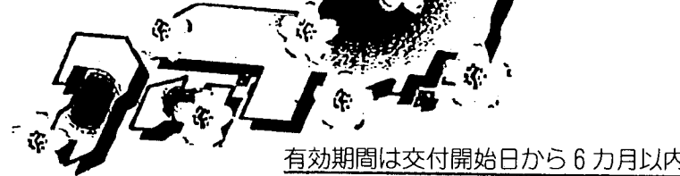
有効期間は交付開始日から6カ月以内です。