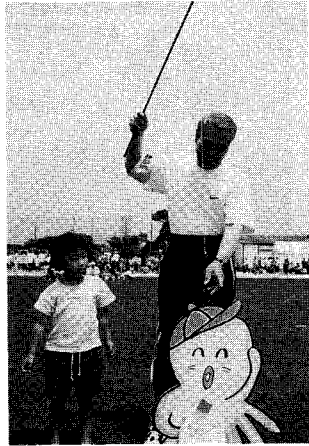
▲おじちゃん(町長)何を釣ったの?