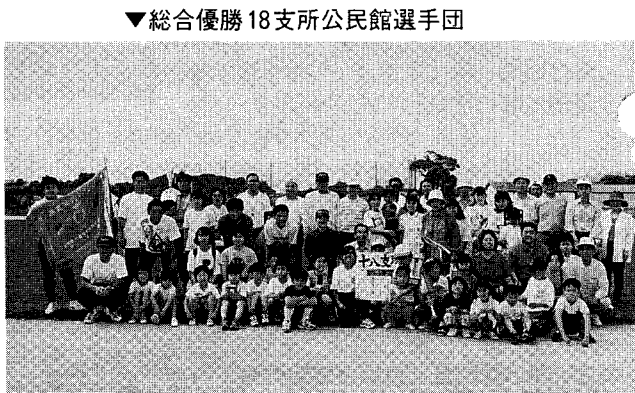
▼総合優勝18支所公民館選手団