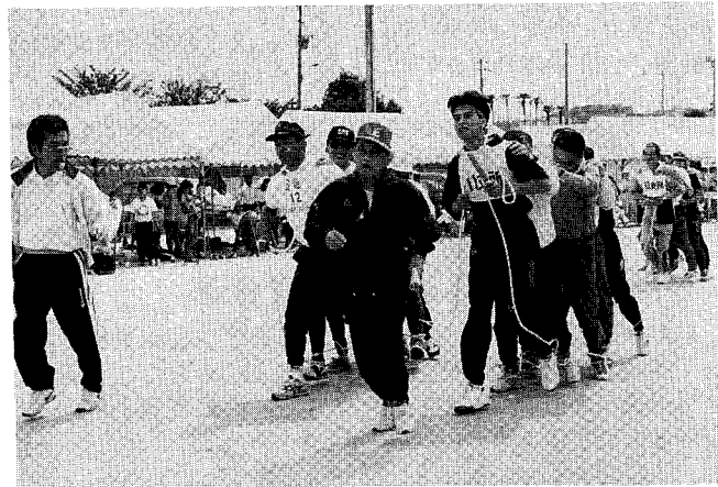
▲恒例のムカデ競争です。イチニ、イチニ足並みそろえて!