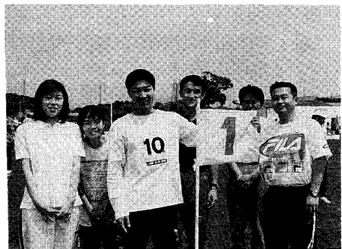
▲職場対抗優勝チーム(町内教職員チーム)