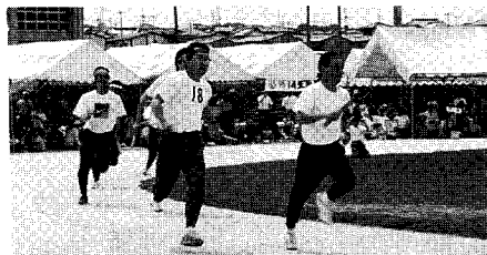
▲頑張る40才台(地区対抗リレー)