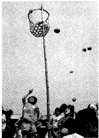
▲ジャンプしてもとどかないよ〜(玉入れ)

五月晴れの5月18日、第36回町民体育祭が盛大に行われた。午前8時30分「選手入場」の掛け声で国旗・町旗を先頭に入場行進が始まった。町民グラウンドに集まった3000人の選手団、どの顔も熱く燃えていた。小学生の障害物競走を皮切りに13種目の競技がスタート。今年も応援合戦は趣向をこらしたもののばかり、特に子どもたちの出場が目立った。大会のハイライトは何といってもリレーの決勝だ。一気に興奮のボルテージが上がる。激走、また激走、熱いドラマの末、地区公民館対抗リレーは、7区公民館が制した。総合優勝は8年ぶりに18支所公民館に輝いた。