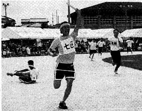
▲今日は頑張ったヨ〜(夫婦対抗)