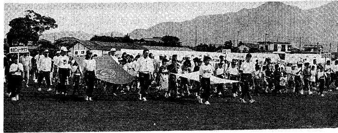
▲選手団の入場です。