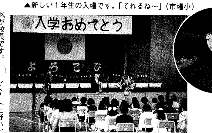
私が校長です。(上野小)

来賓の方が「入学おめでとうございませう」とあいさつすると、元気よく全員で「ありがとございます。ありがとうございました」と返事をしていたのが、とても印象的でした。 二百七十六名の新一年生のみなさん、3年間と6年間、元気にたくましく、いつも大きな声であいさつのできる子に育って下さい。