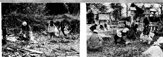
▲1区子ども会の清掃 ▲12支所の神社清掃

4月11日、田川郡民体育大会のゲートボール競技会が、赤池町で行われました。本町から男女4チームが参加しましたが、女性総合3位の成績でした。