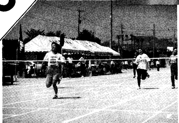
田川郡民体育大会(陸上)