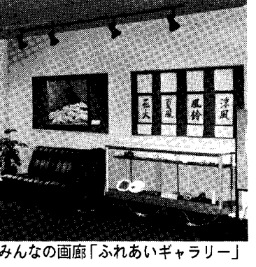
みんなの画廊「ふれあいギャラリー」

「ふれあいギャラリー(画廊)」福祉センターに「ふれあいギャラリー」ができました。このギャラリーでは、みなさんの作品を発表、展示して頂き、交流を図っていくギャラリーです。絵画、写真、書を始め手作り作品等お気軽にご利用下さい。申し込み・問い合わせ 赤池町社会福祉協議会 ☎28局4646番