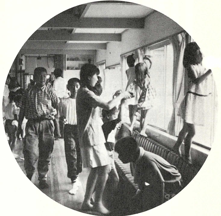
老人ホーム天郷荘