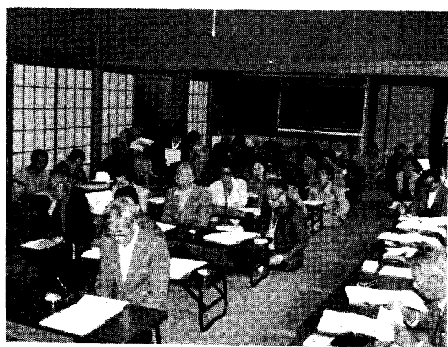
4月22日行なわれた身体障害者福祉会総会