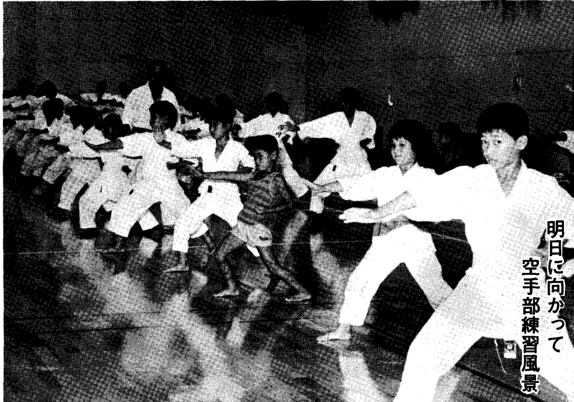
明日に向かつて 空手部練習風景

★町の人口★ 人口10,188 ( 5) 男4,821 ( 3) 女5,367 ( 8) 世帯合計3,416 ( 8) 62年7月末日現在 は前月との比較です