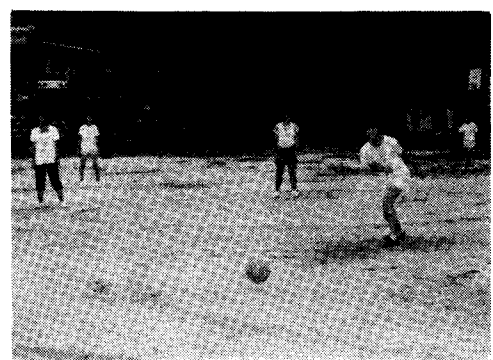
▶ポーンと蹴って準優勝、オリオン▶

赤池町からは八月二日に行われた町子どもスポーツ大会で優勝した七区オリオン子ども会、特に七区オリオン子ども会が練習の成果を随所で発揮し、又、