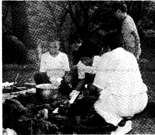
▲たのしい野外料理、味はいかが? 子どもの手による 子ども会づくりをめざして

八月十八日、二十日の三日間山田市熊ヶ畑キャンプ場で各地区子ども会より二十二名が参加してリーダーキャンプが行われました。これはキャンプ生活を通じて子ども会リーダーとしての役割を自覚し、集団生活の基本的技術やルールを学ぶと共に、仲間意識を高め、今後の子ども会活動に役立てることを目的としたものです。 毎年恒例のキャンプですが、今年には少数精鋭で取り組むことができ、一人ひとりに十分な指導が行き届きました。 日常生活で体験できないことを仲間と寝食を共にしながら、自分の努力と工夫、協力とで成し遂げることが、本来キャンプの意義だと思ひます。 今年参加した二十二名の子ども