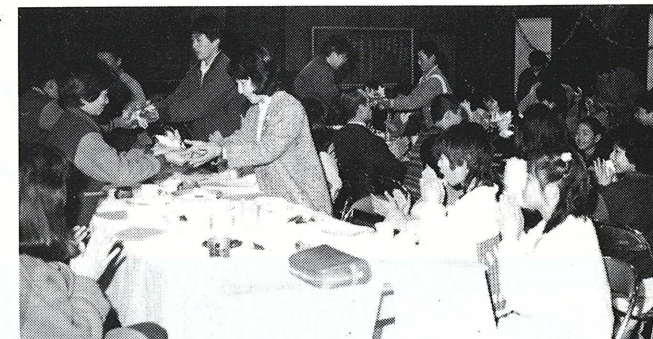
会食会で全先生に花束をプレゼント

在校生のアーチの中を入場した六年生に、1年生は手づくりのメダルをプレゼント。歌や色んな出し物で六年生と別れる前の楽