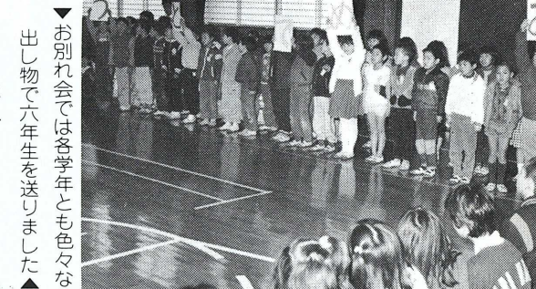
お別れ会では各学年とも色々な出し物で六年生を送りました