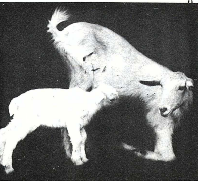
（80）200ズーム、F5.6 1/500秒 ASA400増感

たくさん魚を贈られたお年寄りは大喜び。天郷荘では、さつそくその日の夕食にサシミにして、みんなでいただきました。