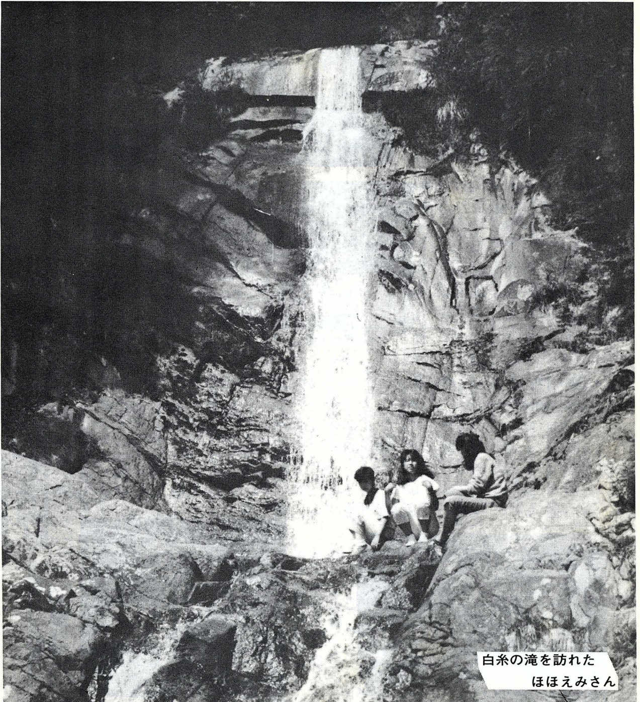
白糸の滝を訪れた ほほえみさん

発行所 赤池町役場 編集 総務課 文書広報係 ☎(代表)28-2004 印刷所 赤池印刷 毎月1回発行