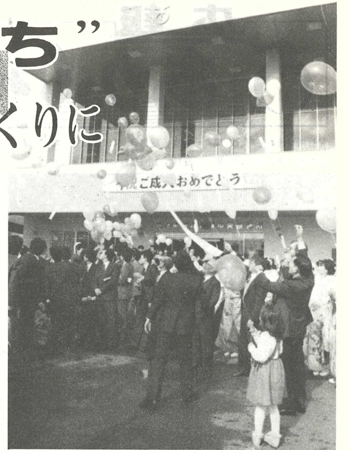
▶ 「人から尊敬されるようになりたい」「責任をもち行動したい」など、それぞれの決意を書いた紙をつけ、風船を大空に飛ばす88人の新成人のみなさん

恒例の松の内成人式が一月三日、同和对策中央研修所で行われました。 今年の対象者は東京オリンピックが開かれた昭和三十九年四月二日から四十年四月一日までに生まれた男子七十人、女子五十六人の百二十六人で、昨年より二十人少なくなっています。男子四十九人、女子三十九人の八十八人が出席し、社会人としての門出を祝いました。