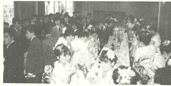
▶ 式典のあとジュースでカンパイ