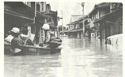
【町部269戸が床上浸水した昭和54年6月30日の豪雨】

⑤残存鉱害の早期完全処理 赤池町の鉱害は、年々復旧がなされているが、一番大きな問題である町部三百十戸の毎年定期的にかかる水害の解決が今一つ遅れている。鉱害復旧という千載一遇のこの機会に、低環境、不環境、同和混住地域の環境整備の、どの制度が一番適切かを検討して、都市計画を含めての鉱害完全復旧がこの機会にできないか、今後の課題として関係者と話し合いながらその行政上の責任を果たしていきたい。