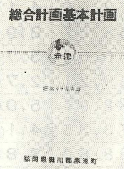
【昭和48年に策定された赤池町総合計画の基本計画書】

議会代表等と交え、幅広い意見を聞きながら、もう一度我が町の進む方針を示したマスタープランを作成していく。