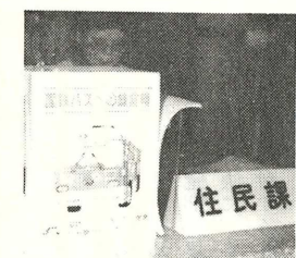
【役場住民福祉課戸籍係カウンターに備えられた国鉄バスへの提言箱】