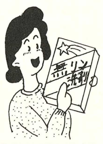
「石けん」や「リン」を含まない洗剤を使用してください。