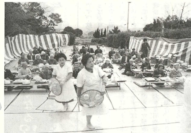
【心づくしのごちそうを食べながら楽しい1日。天郷荘の花見】