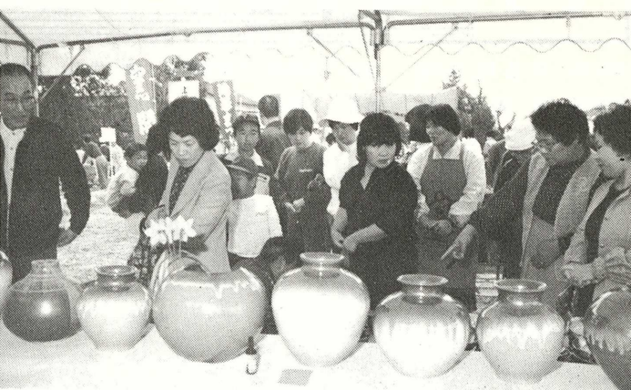
【「もう少し安くならんねー」、にぎやかな陶器まつり】

第十一回上野焼陶器まつりは、四月十四日から三日間行われ、好天にも恵まれ、過去最高の人出となりました。