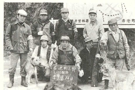
【上野平の池近くで仕留められたイノシシ】

町産業振興課では、イノシシとカラスの駆除を行いました。イノシシは、数年前から上野山間部を中心に数頭が出没し、水稲や野菜、植林した樹木の苗などを食い荒し、農作物の被害が著しいため県の許可を受け、地元猟友会のみなさんの協力を得て、銃器により行いました。 また、カラスは主に果樹の被害で、町も以前から頭を痛めています。が、今回は、農林事務所職員とアフリカンサファリなどに視察に行き職員の手作りで、三ヶ四方の捕獲器を作りました。 一日、二、三羽のカラスが捕れており、成果があれば果樹部会とも協議し、増やしていく予定です。