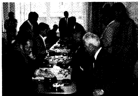
「中央研修所で 行われた囲碁大会」