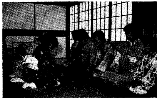
【町民会館で行われた茶会】