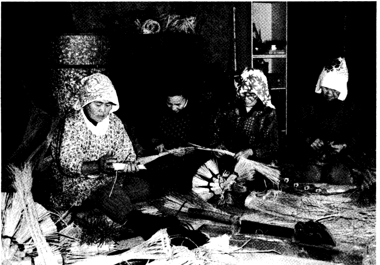
【正月を前に、しめなわ、づくりに忙しい農家のみなさん(鋤木田で)】