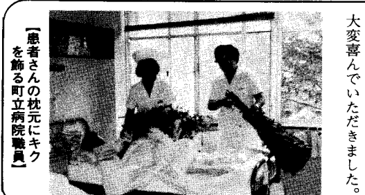
【患者さんの枕元にキクを飾る町立病院職員】

ら中、藤の匂いがただよっていました。藤棚の下のベンチに長いこと腰かけて藤の風を楽しんだものです。 ○黒椿不思議と蝶の見当らず ○水馬酔まり返るときはねる 一歩 ○藤房の風の素通りする長さ ○吹雪くとは藤にも言へてそれが 是るの女 ○良き香とはすぐになじみて藤棚に 是るの女 ○藤棚を去るとき新たな香り 是るの女 ○中食は名代のうなぎ飯屋でとることにしましたが、長いこと待たされました。 ○うなぎ焼く匂ひの街に白秋碑 是るの女 再び宿に戻り藤棚の下にベンチを寄せて二回目の句会をすることにしました。