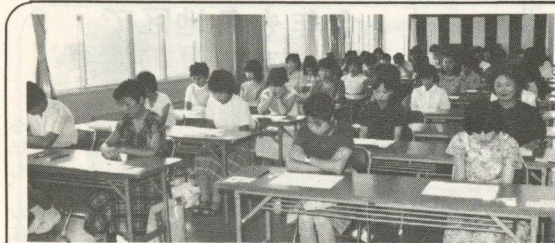
【真剣に試験説明を聞く 受験の皆さん(7月31日・町民会館で)】

贈らない・求めない・受けとらない 選挙の時にきざらず、日ごろからみんなが「きれいな選挙」を心がけましょう。