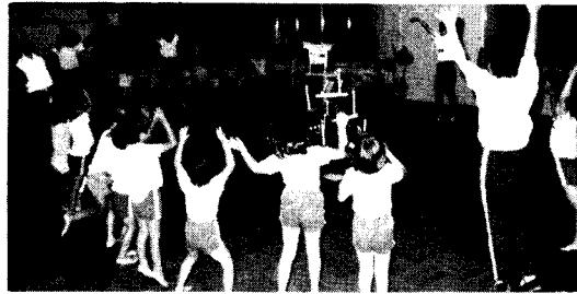
【ローソクファイヤーを囲み楽しいダンス】(上野保育所で)