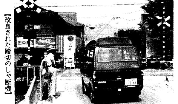
【改良された踏切のしゃ断機】