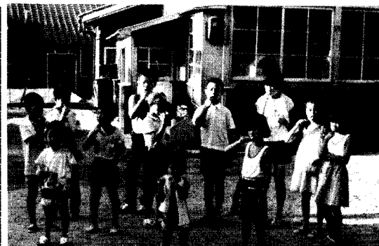
差別をなくすために9