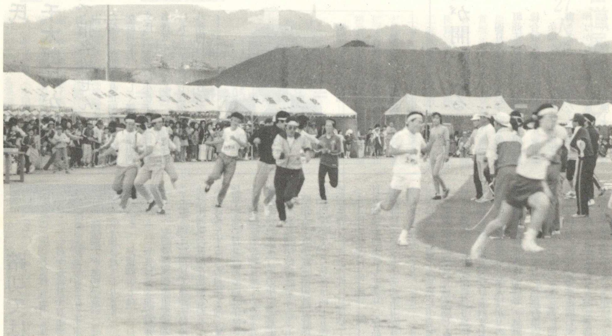
【写真は力走の職場対抗リレーのみなさんたち】