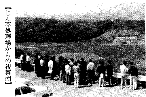
【じん芥処理場からの視察団】

同和事業は部落だけのためのものでなく、すべての住民への行政水準を高めることにつながります。同和対策事業の一例をあげますと、部落を校区にふくむ学校の施設充実の対策によつて、その学校に通学する部落外の子供たちにも大きな利益をもたらしている事を学ばなければなりません。つづく