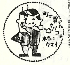
たばこは町内で買ひましょう

赤池支部だより ⑤ 田川交通安全協会 赤池支部特別賛助者 七月二十六日から八月四日まで 行われた夏の全国交通安全運動期 間中、主として学童と老人を事故 から防止する運動を実施しました が、町民各位のご協力により、大 した事故もなく終わったことを感謝 しております。ただ、この上お願 いしたいことは、お盆をはさんで の永い間の夏休みの疲れのする時 二学期をむかえ、心のゆるみから 自由な生活が事故に結びつく件数 が多くなることです。 もちろん、全国的に行われる秋 の運動期間に入りますが、それを 待つまでもなく交通ルールを守る よう、この上ともご協力をお願い いたします。 なお、次の方より交通安全協会 赤池支部へ支部運営資金として金 一封いただきましたので、報告い たし厚くお礼申し上げます。 ◎西日本設計株式会社